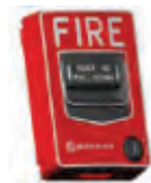
อุปกรณ์แจ้งเหตุเพลิงไหม้แบบดึง