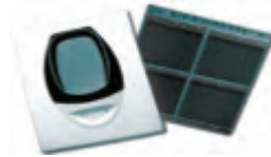
อุปกรณ์ตรวจจับควันไฟแบบต่อเนื่อง (Linear Type)