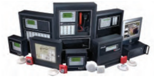
ตู้ควบคุมระบบสัญญาณแจ้งเหตุเพลิงไหม้