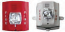
อุปกรณ์เตือนภัยแบบแสงและเสียง