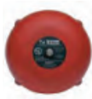
อุปกรณ์เตือนภัยแบบเสียง