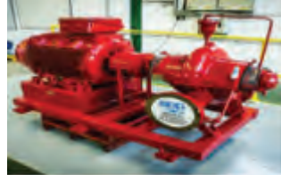
ปั๊มสูบน้ำดับเพลิง (Fire Pump)

ผลิตภัณฑ์กลุ่มที่ 2: กลุ่มระบบดับเพลิงอัตโนมัติชนิดต่างๆ (Fire Suppression System) ได้แก่ ระบบดับเพลิงด้วยน้ำ ระบบดับเพลิงด้วยโฟมดับเพลิง ระบบดับเพลิงด้วยก๊าซ และระบบดับเพลิงด้วยสารสะอาดดับเพลิง