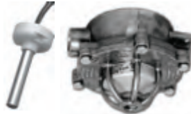
อุปกรณ์ตรวจจับความร้อนชนิดกันระเบิด (Explosion Proof Type)