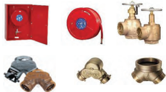
หัวรับน้ำดับเพลิง (Fire Department Connection)

1.3.1) ตู้เก็บสายฉีดน้ำดับเพลิง (Fire Hose Cabinet) เป็นตู้ส่งน้ำดับเพลิง มีลักษณะเป็นตู้สีแดง ด้านหน้าเป็นกระจก ที่สามารถเปิด หรือทุบให้แตก เพื่อนำอุปกรณ์ช่วยเหลือออกมาได้เมื่อเกิดเหตุฉุกเฉิน โดยบริษัทมีการจำหน่ายสินค้าประเภทนี้ของตนเองภายใต้ตราสินค้า “TOTAL FIRE”