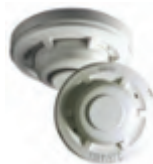
อุปกรณ์ตรวจจับความร้อน (Heat Detector)